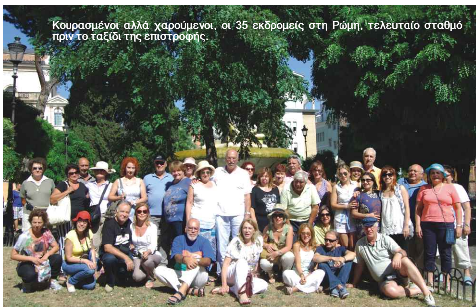
Κουρασμένοι αλλά χαρούμενοι, οι 35 εκδρομείς στη Ρώμη, τελευταίο σταθμό πριν το ταξίδι της επιστροφής.

–μία κατά την αναχώρηση και μία στην επιστροφή– μία στη Βενετία , τέσσερις σε γραφικό παραλίμνιο χωριό της περιοχής Salzkammergut και ειδικότερα πέριξ της λίμνης Wolfgang “Wolfgangsee” (σημ.: μέχρι την ώρα που τυπώνεται αυτό το άρθρο δεν έχει ακόμη επιλεγεί η συγκεκριμένη τοποθεσία) και η τελευταία στην Μπολώνια , πριν την επιστροφή μας στην Αγκόνα.