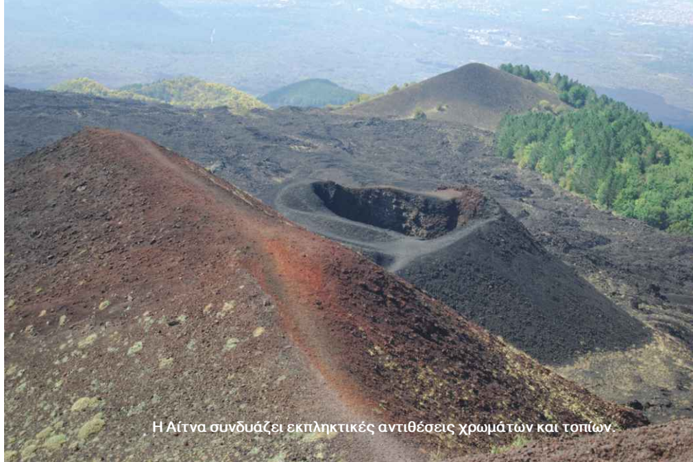
Η Αίτνα συνδυάζει εκπληκτικές αντιθέσεις χρωμάτων και τοπίων.

«Πρόκειται για μια 9ήμερη οδική εκδρομή στην Αυστρία από τις 21 έως 29 Δεκεμβρίου η οποία περιλαμβάνει δύο διανυκτερεύσεις εν πλω